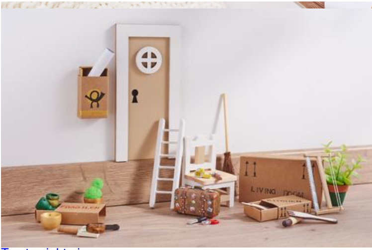
Tomte zieht ein