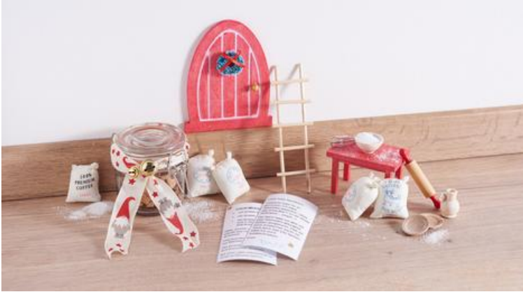
Tomte backt Kekse