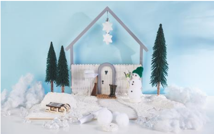
Tomte baut einen Schneemann