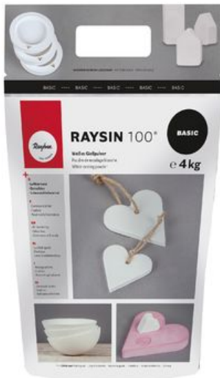
Gießpulver "Raysin 100", weiß, 4 kg