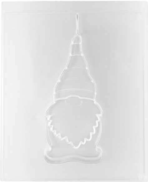
Gießform "Wichtel", Groß