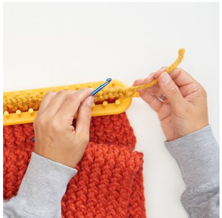
11 Schließlich das Fadenende vernähen.