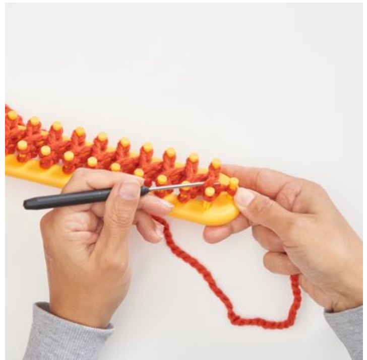
5 Wie beschrieben Reihe für Reihe weiter stricken und wickeln.