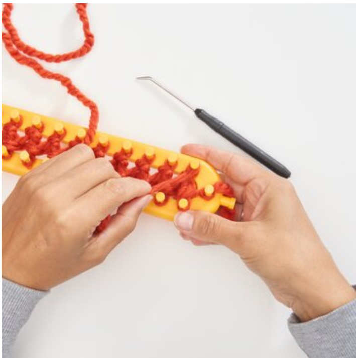
5 Neue Reihe wickeln