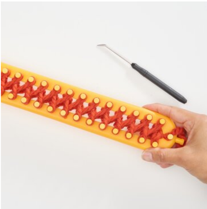
5 Bereit für die nächste Strickreihe.