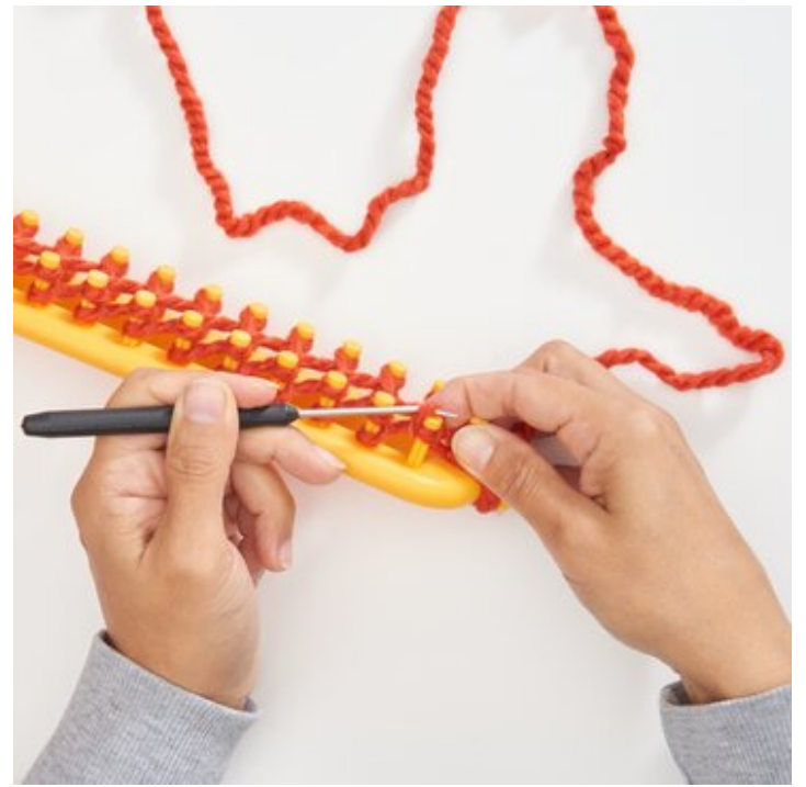
4 Erste Masche stricken