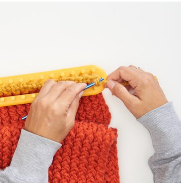
10 ..bis alle Maschen abgemascht sind.