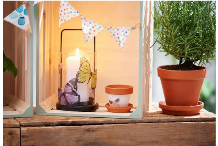
Serviettentechnik auf Glas