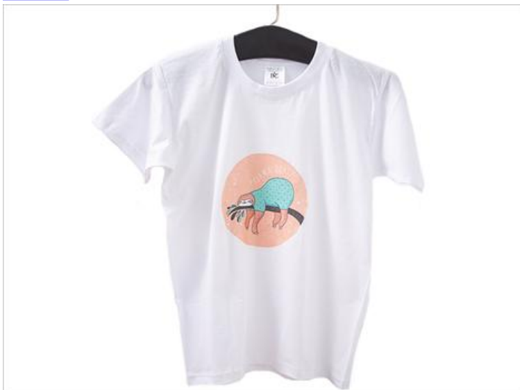
T-Shirt mit Serviette